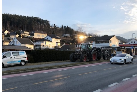
2) Hanamyrveien 2 (ombygging fra bakeri til Rema-butikk)